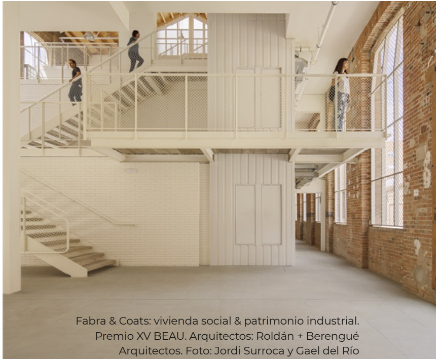
Fabra & Coats: vivienda social & patrimonio industrial. Premio XV BEAU. Arquitectos: Roldán + Berengué Arquitectos.

Dentro de la Componente 2 del Plan de Recuperación, Transformación y Resiliencia, dotado con 6.820 millones de euros, se ha incluido el punto C2.I5 Programa de impulso a la rehabilitación de edificios públicos (PIREP). Se ha planteado con una clara vocación ejemplarizante y el carácter integrado que reclama la Agenda Urbana Española y la nueva Bauhaus europea (sostenibilidad, inclusión y estética), sin perder de vista el principal objetivo del ahorro energético.